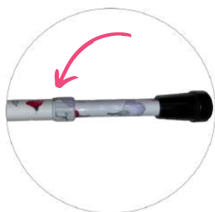
Desserrez la bague de serrage